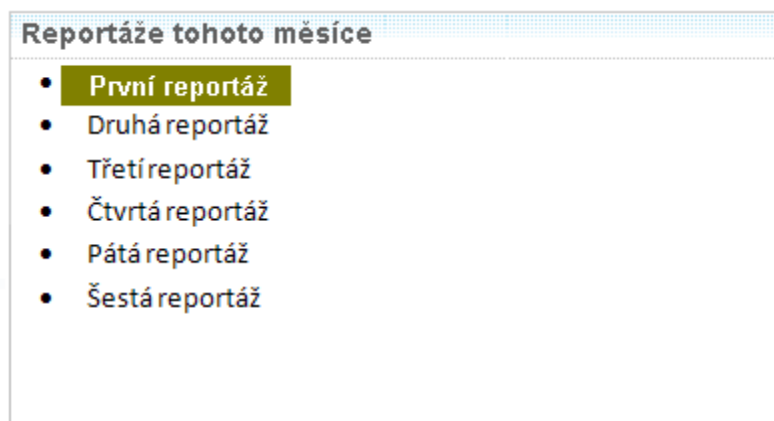
Obrázek 5-3: Reportáže aktuálního měsíce.

Jednotlivé reportáže daného měsíce jsou dostupné v dalším portletu: