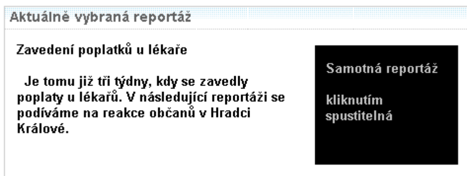
Obrázek 5-2: Grafický návrh reportáží.

Jednotlivé reportáže daného měsíce jsou dostupné v dalším portletu: